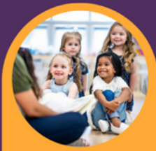
Cymorth, hyfforddiant ac adnoddau am ddim

Medrwcw gael mwy o wybodaeth drwy anfon e-bost at childcare@monmouthshire.gov.uk nawr.