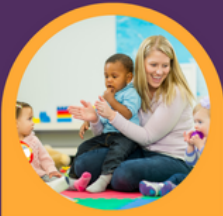
Darparu gwasanaeth gwerthfawr i rieni lleol