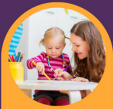
Gweithio o'ch cartref a gosod eich oriau eich hun

*Hyfforddiant am ddim, grantiau sefydlu, cysylltiadau i warchodwyr plant eraill, hyrwyddo am ddim a mwy.