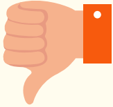
Beth nad ydych yn ei hoffi