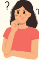
A'r hyn a gewch yn anodd