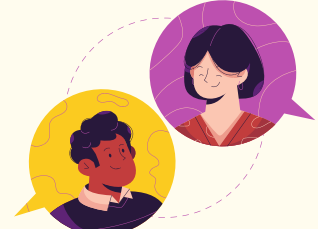
Cwrdd â chi eto i ganfod sut mae pethau'n mynd