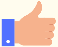
Beth ydych chi'n ei hoffi

Siarad gyda chi, eich athrawon a'ch rhieni/gofalwyr i ganfod mwy am: :