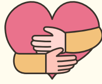
Ac os oes problem, beth allai helpu gyda hynny