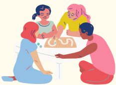
Dod ymlaen gyda phobl eraill