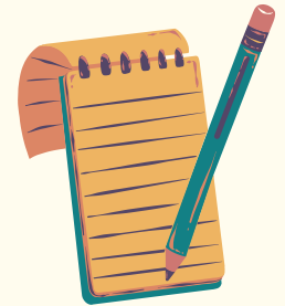
Bydd hyn yn cael ei ysgrifennu i lawr ac ei rannu gyda chi, eich teulu a'ch ysgol/lleoliad