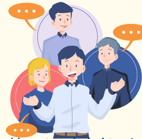
Bydd yr SA a'r bobl sy'n eich adnabod yn dda yn edrych am syniadau i helpu a gwneud cynllun