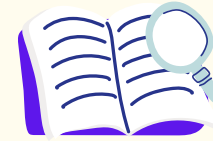
Edrych ar eich gwaith/ymuno â gwers