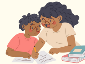
Gweithio gyda chi ar rai tasgau